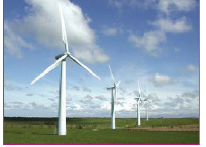
चित्रम् 1.1 पवन-पेषणी

प्राकृतिकसंसाधनानां वितरणं भू-भागकारकं जलवायुकारकम् औनत्यकारकं च इत्यादिषु विविधेषु भौतिककारकेषु आश्रयति । भू-भागे एतेषु कारकेषु वैविध्यकारणात् संसाधनानां वितरणम् असमानम् अस्ति ।